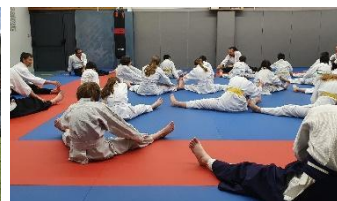
Interclub jeunes à TULLINS