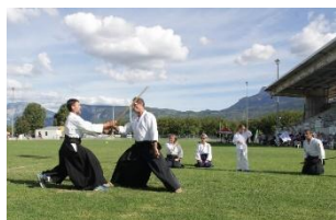
Démonstration au forum des associations de TULLINS

Lundi : 20h00 - 22h00 : Adultes Mercredi : 17h15 - 18h30 : Enfants + Ados Jeudi : 20h15 - 22h00 : Adultes + Ados Samedi : 10h00 - 12h00 : Aïkido doux